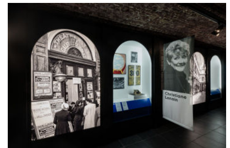
Exposition « 75 Ans - Les Galeries Royales Saint-Hubert » au Cinéma les Galeries - 2022